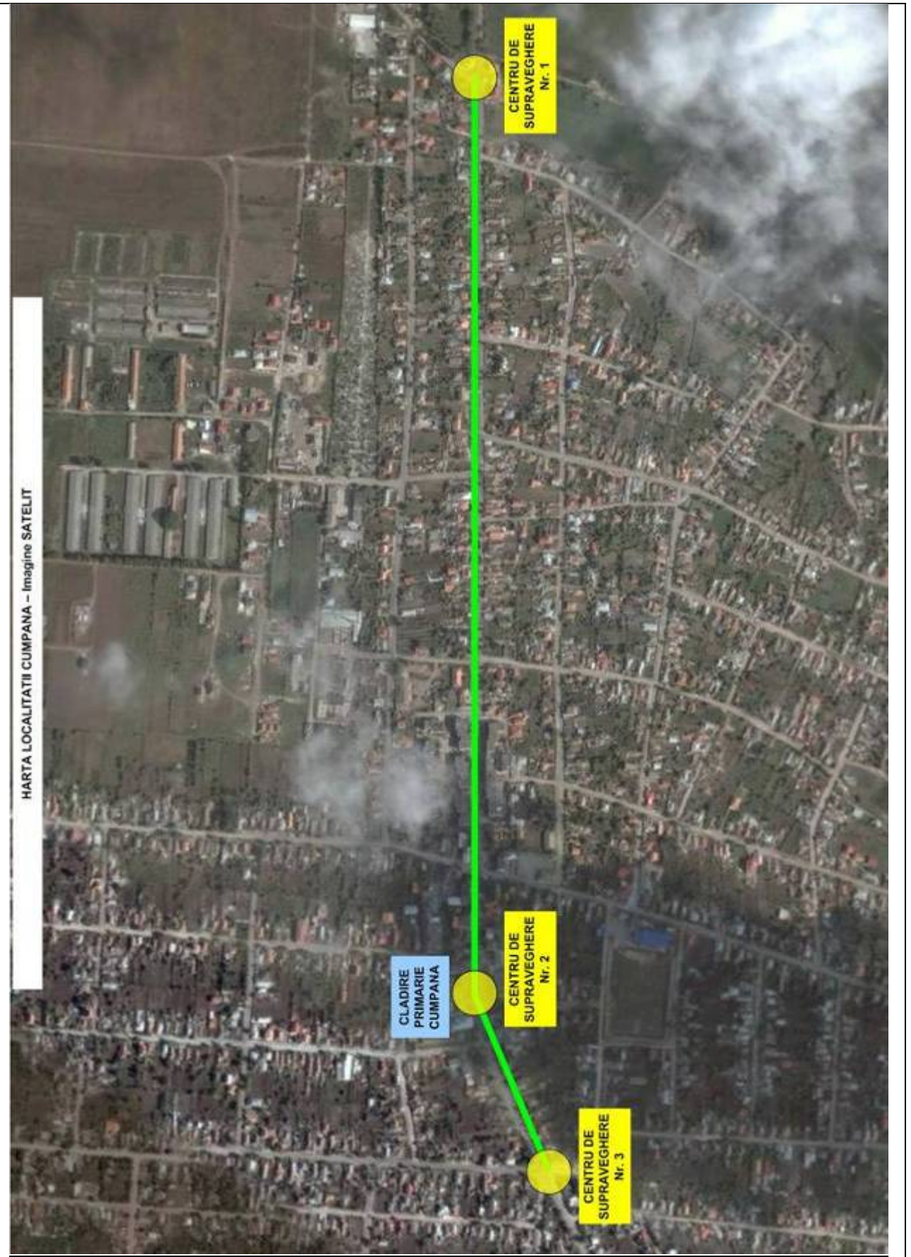
HARTA LOCALITATII CUMPANA – Imagine SATELIT